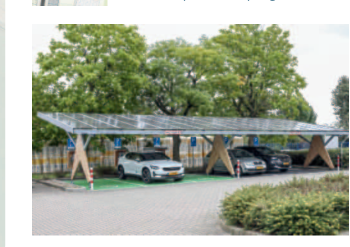
Referentie mogelijke solarcarporten boven openbare parkeerplaatsen