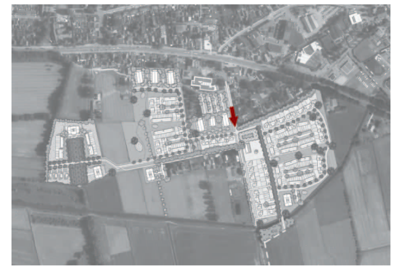
Wonen aan de Jukweg